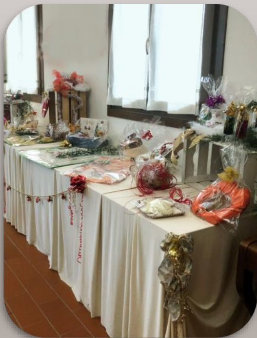
Foto oggetti esposti in sala San Francesco

nella sala san Francesco e i risultati si troveranno nella bacheca della chiesa del Monastero.